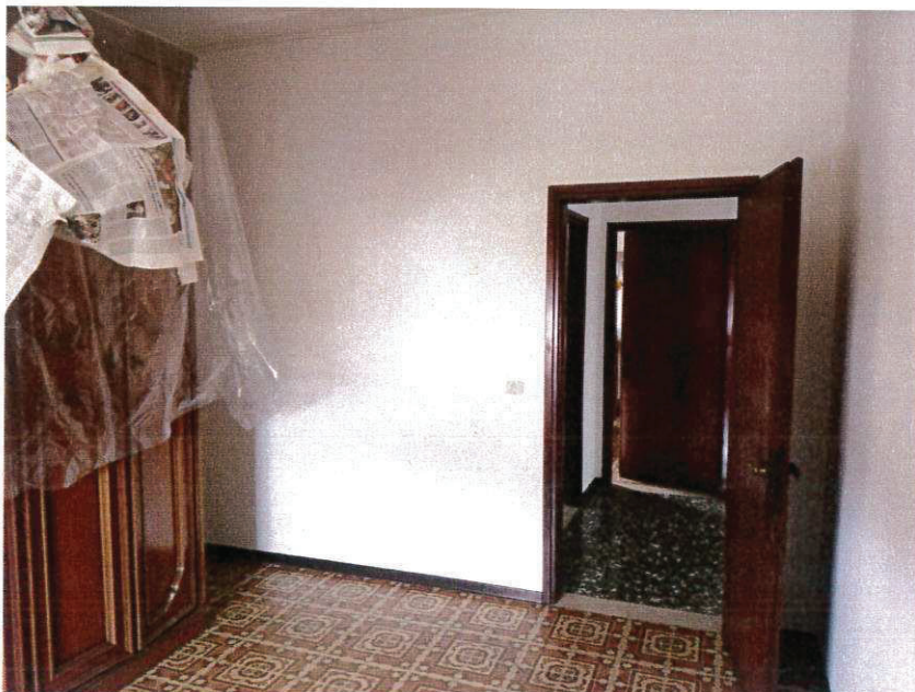
SUB 3 - CAMERA N-W