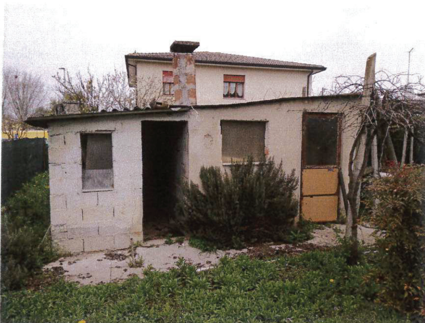
SUB 3 – ANNESSO / RIPOSTIGLIO