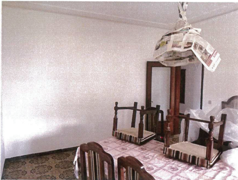
SUB 3 - SOGGIORNO