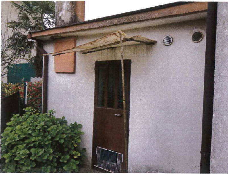
SUB 4 - CENTRALE TERMICA