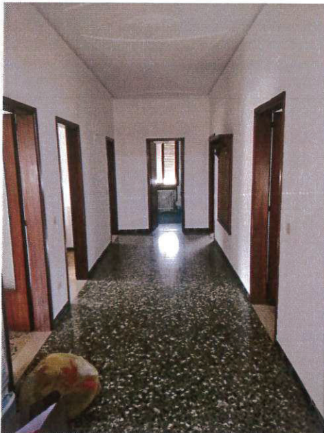
SUB 3 - CORRIDOIO CENTRALE