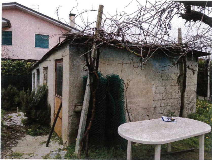
SUB 3 – ANNESSO / RIPOSTIGLIO