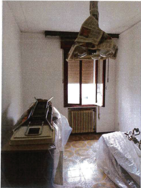
SUB 3 – CAMERA W