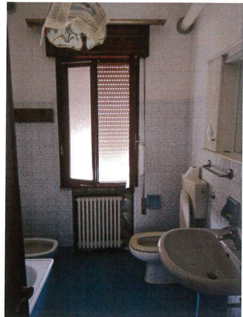
SUB 3 - BAGNO