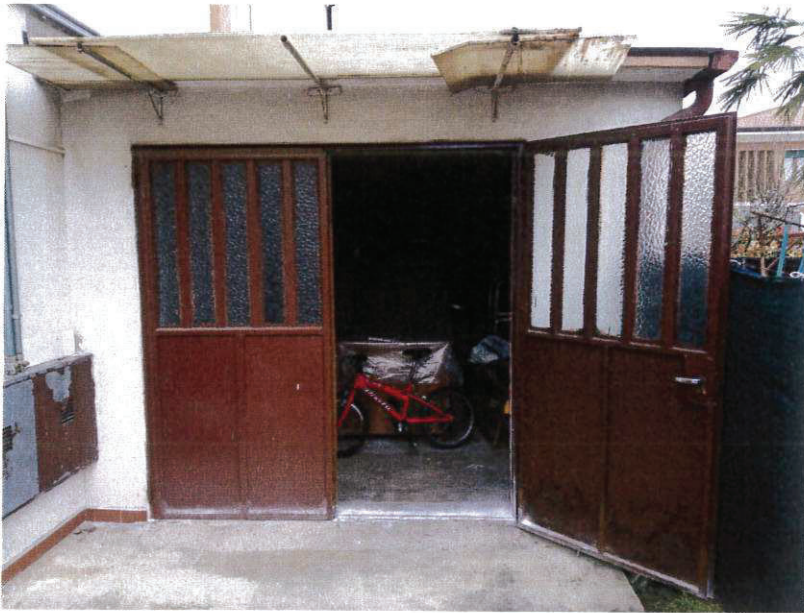
SUB 4 - GARAGE